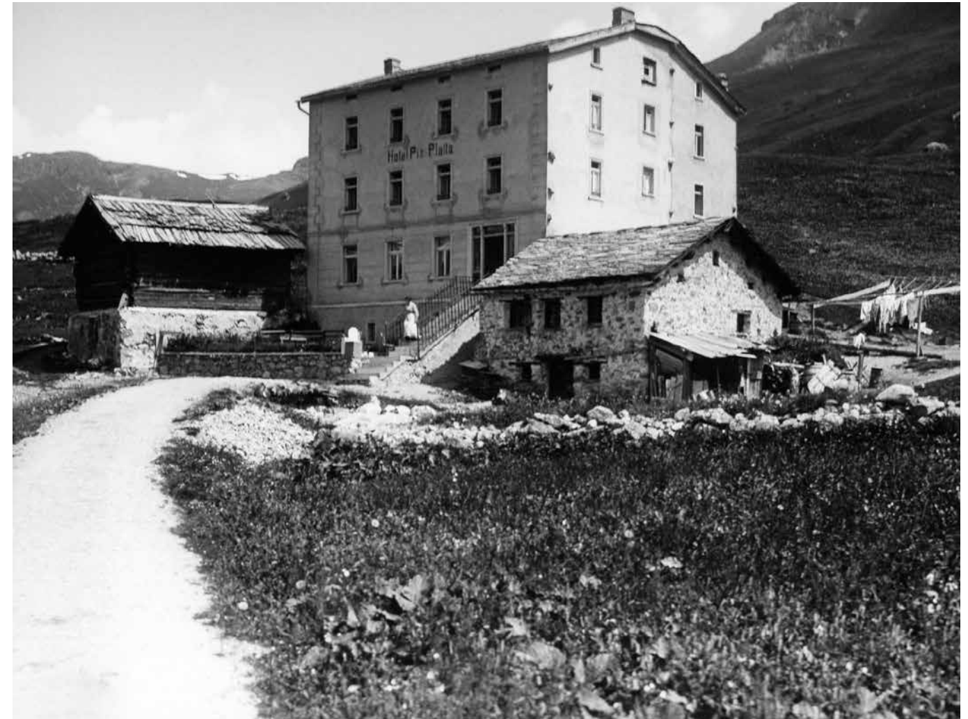
Hotel Piz Platta 1908

Das Berghaus Piz Platta befindet sich auf dem Hochplateau Alp Flix inmitten von Mooren und intakter Natur. Hier gibt es kein Fremdlicht, und der Natelempfang ist nur sporadisch. Das Berghaus ist ein Geheimtipp für Ruhesuchende, Genussmenschen und Naturliebhaber, welche die Einzigartigkeit der Alp schätzen. Unser Motto ist «Wir haben nichts, davon aber sehr viel». Kulinarisch erwartet unsere Gäste eine gradlinige Küche mit vielen regionalen Produkten und italienischem Einschlag. Wir verstehen es «nicht», mit dem Strom zu schwimmen. Wir setzen unsere eigenen Ideen um und freuen uns immer wieder, unsere Gäste mit unseren Kreationen zu überraschen. Unsere Gäste dürfen sich auf ein breites Angebot an Weinen und delikaten Destillaten freuen, welche man mit Sicherheit in einem Berghaus nicht erwartet. Mehr Infos über unser kleines Paradies gibt es unter www.flix.ch