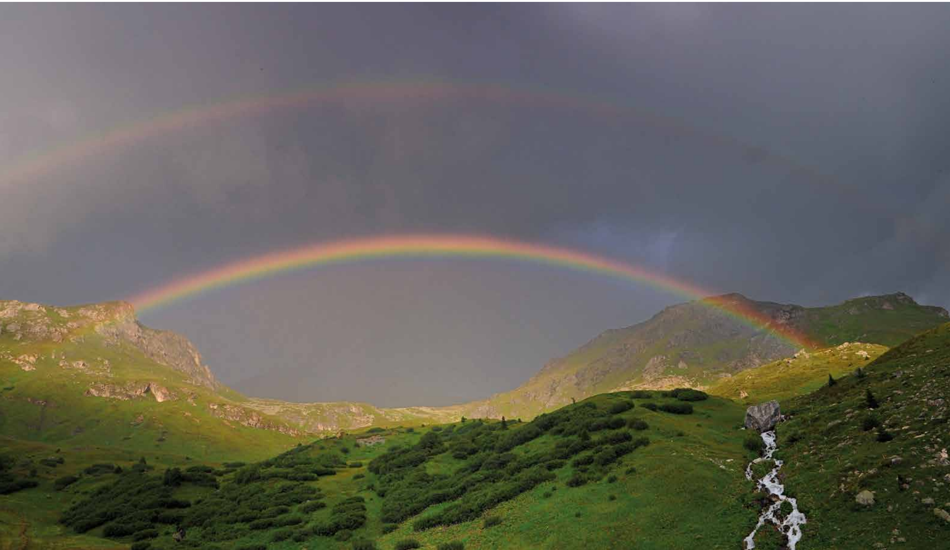
Nach einem Sommergewitter kehrt die Sonne zurück und spannt einen Bogen über uns.