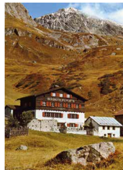
Berghotel Piz Platta 1937