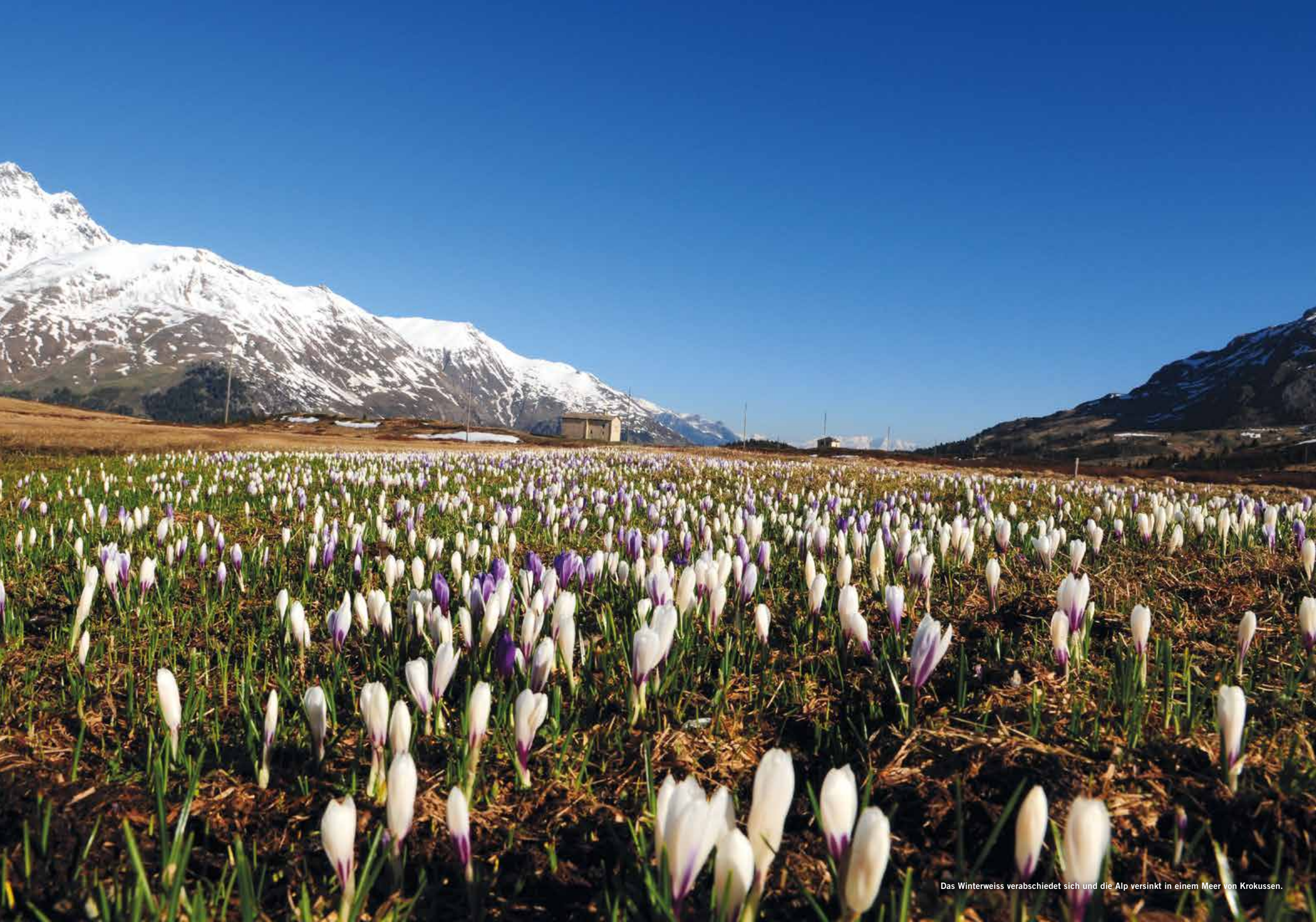
Das Winterweiss verabschiedet sich und die Alp versinkt in einem Meer von Krokussen.