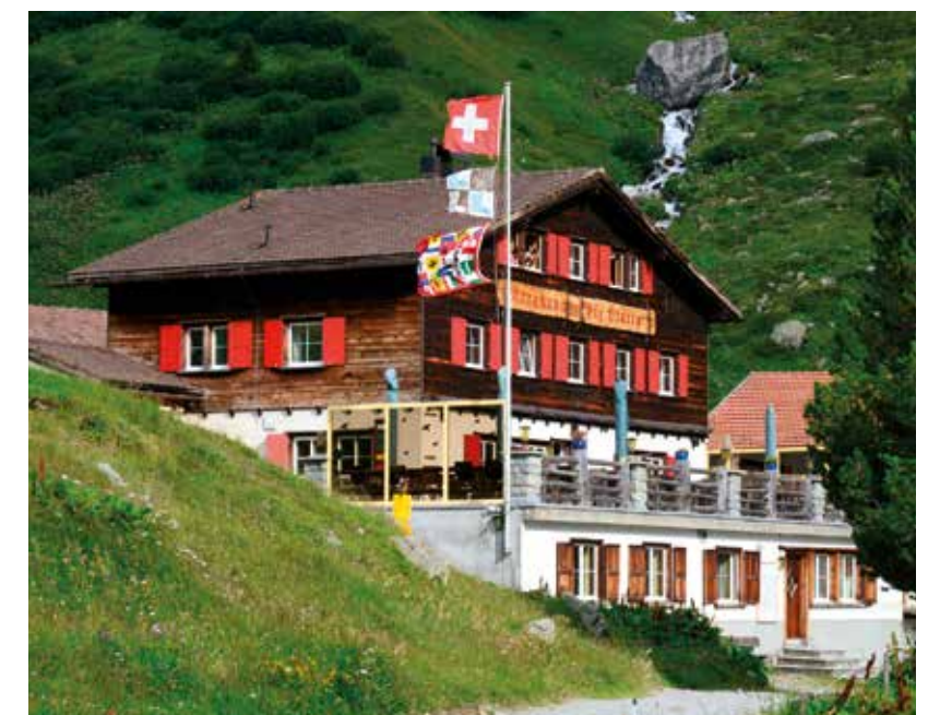
Berghaus Piz Platta 2000