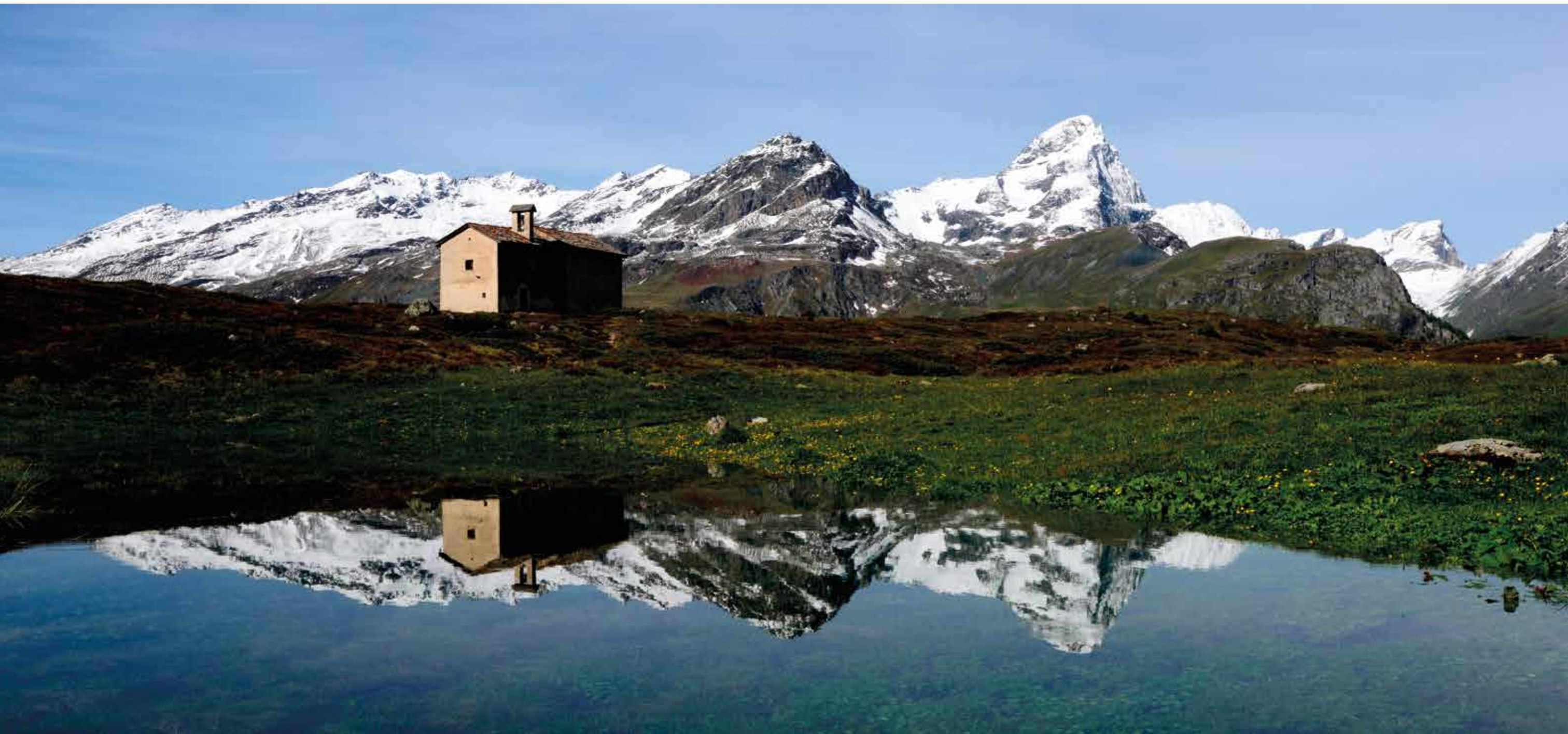
Nur an wenigen Tagen, nachdem der Schnee geschmolzen ist und einen Schmelzwassertümpel hinterlassen hat, ist es möglich, der Kapelle Son Roc ein Spiegelbild zu geben.