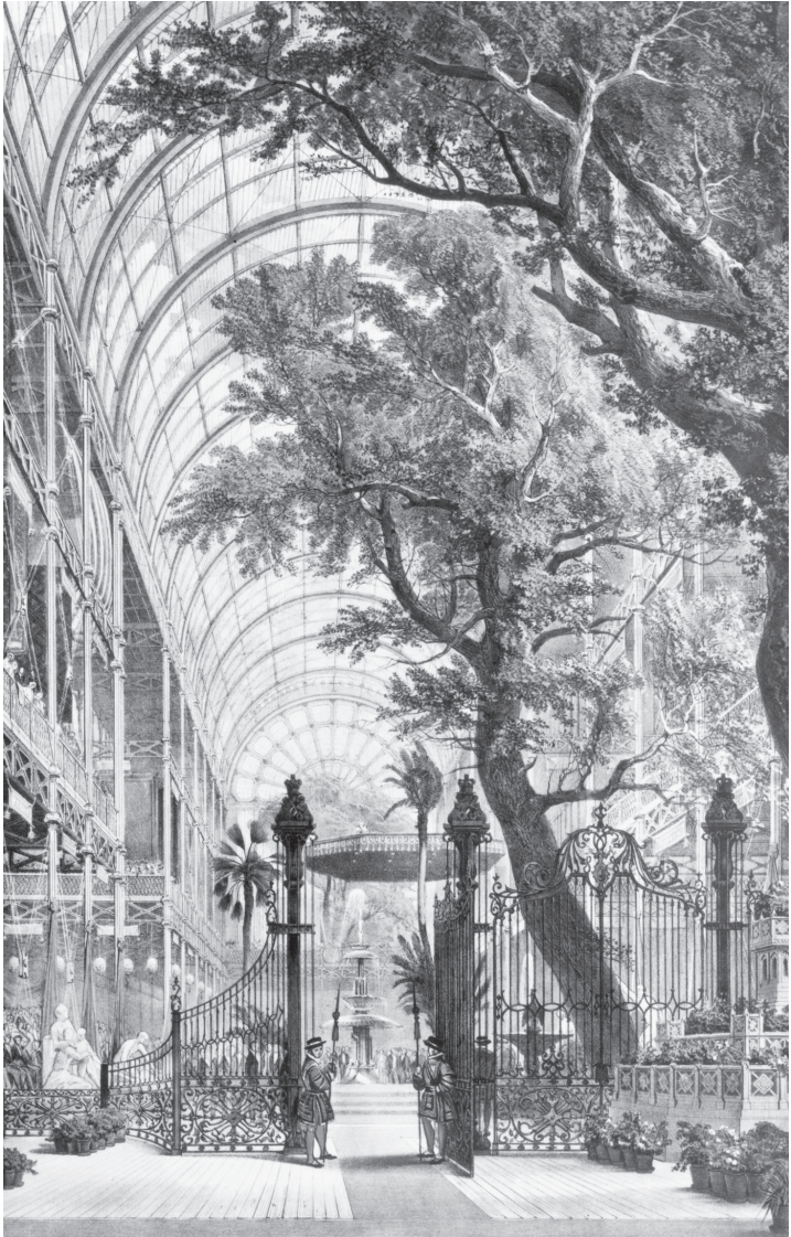
Innenansicht von Joseph Paxtons lichtdurchflutetem Kristallpalast bei der Weltausstellung 1851. Das Tor steht heute in Kensington Gardens.