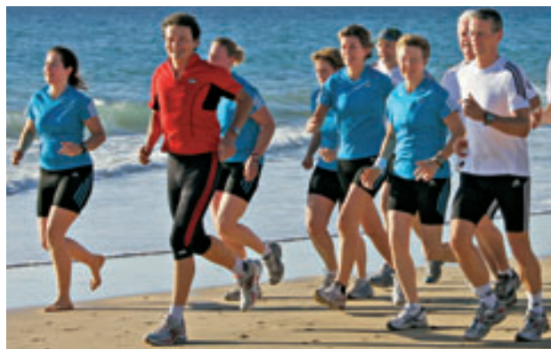
Laufen – und alles läuft besser!