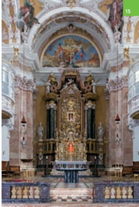
Innsbruck, Dom St. Jakob, Presbyterium

Der Innenraum – eine Saalkirche mit Vierung und gerade abgeschlossenem Presbyterium – hingegen beeindruckt mit der harmonischen Gliederung von drei aneinandergereihten Flachkuppeln und der im Chor anschließenden kreisrunden Tam-