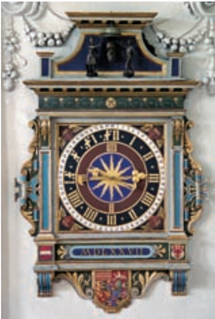
Innsbruck, Hofkirche, Renaissanceuhr