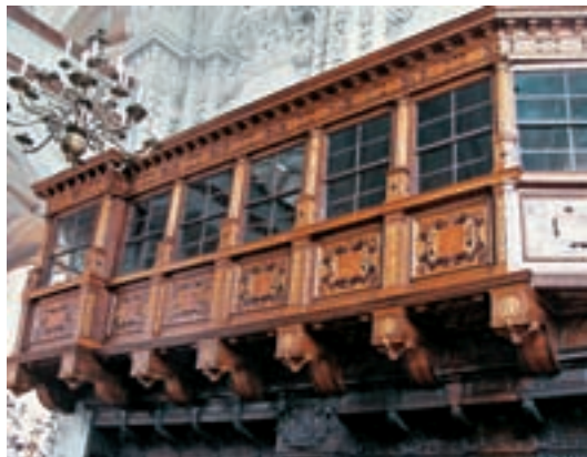
Innsbruck, Hofkirche, Fürstenchor