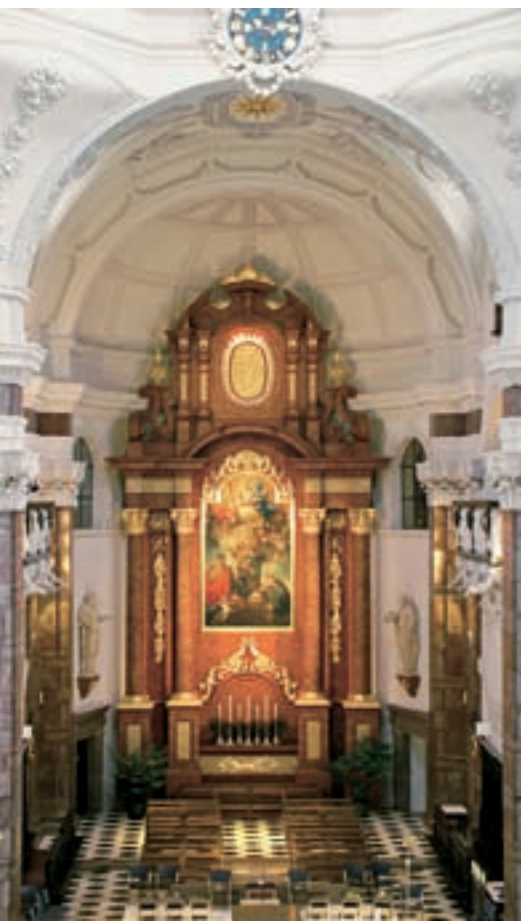
Innsbruck, Jesuitenkirche Hl. Dreifaltigkeit, Presbyterium

Zielpunkt jeder barocken Inszenierung des Sakralen ist der Hochaltar, mit einem deutlich lesbaren, großen Altarbild als Zentrum der Didaktik und dem Tabernakel als Höhepunkt jeder Messfeier. Leider wurde der Innsbrucker Hochaltar aus dem Jahr 1757 bei einem Bombenangriff 1943 zerstört. Anhand von Fotos, Skizzen und Stichen wurde er im Jahr 2004 als historisierendes Pasticcio rekonstruiert: Das