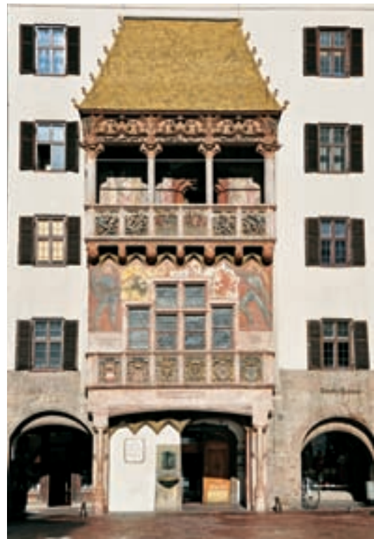
Innsbruck, Neuer Hof, Goldenes Dachl

als sinnvoll erachtet. Die ausgewählten Objekte wurden, dem bewährten Schema des Dehio-Handbuches folgend, nach Sakral- und Profanbauten gereiht. Die zahlreichen Restaurierungen, wissenschaftlichen Untersuchungen und Befundungen der letzten Jahre haben zu einer Fülle von neuen Erkenntnissen geführt, die von den Autoren/innen in ihre Texte eingearbeitet wurden und so erstmals einer breiten Öffentlichkeit zugänglich gemacht werden können. Eine kurze Einleitung dient der Charakterisierung des Bezirkes, der in seiner Geschichte, wirtschaftlichen und künstlerischen Entwicklung dargestellt und so dem Leser nahegebracht wird. Die Beschreibung der Objekte wurde auf das Wesentliche beschränkt, ihre historische und kunsthistorische Bedeutung prägnant charakterisiert.