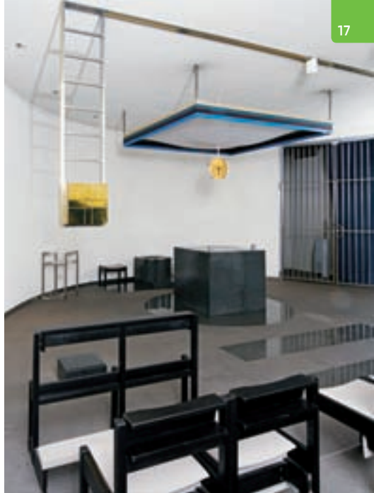
Innsbruck, Dom St. Jakob, Unterkerche