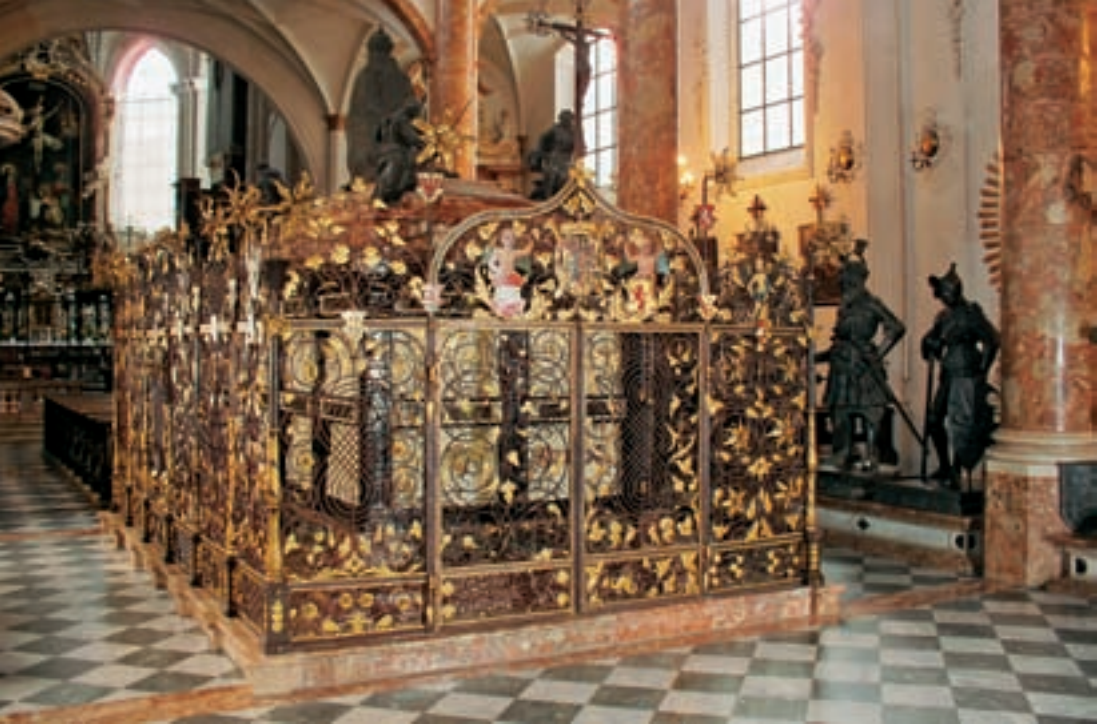
Innsbruck, Hofkirche zum Hl. Kreuz, Grabmal Maximilians I.