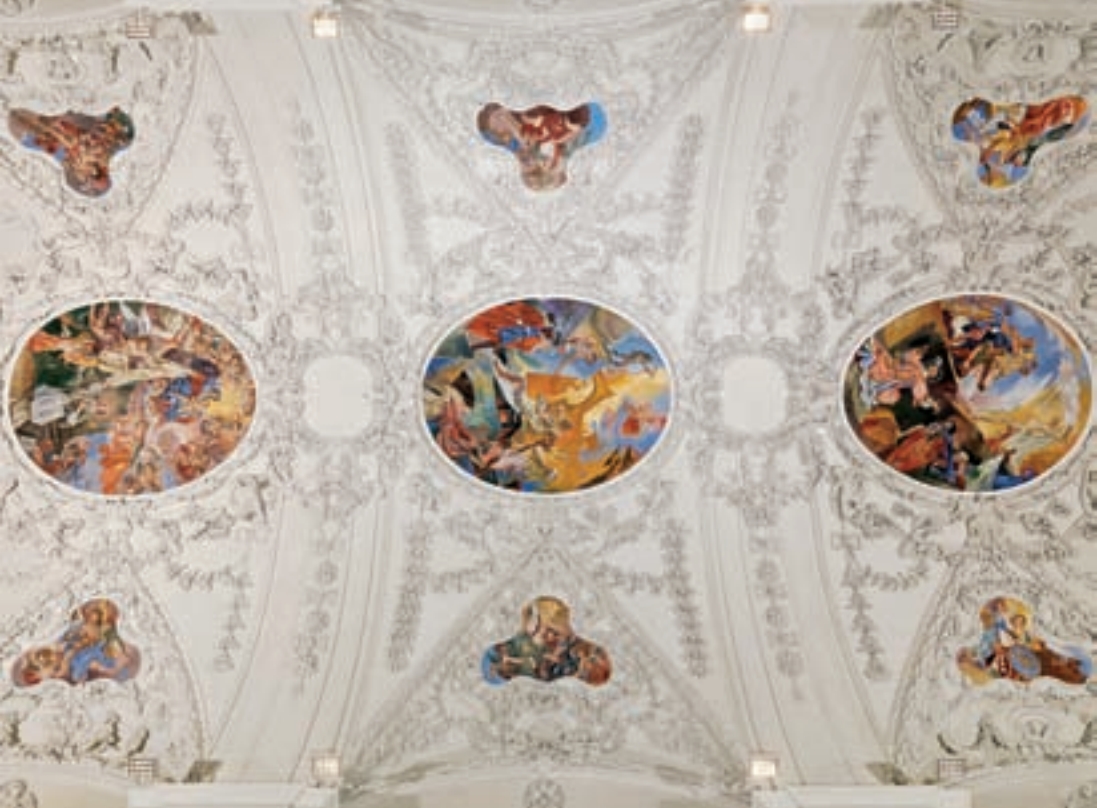
Innsbruck, Stiftskirche zu den hl. Laurentius und Stephanus, Langhausgewölbe

den Tiroler Landesfürsten Leopold V., Claudia de' Medici und deren Sohn Erzherzog Ferdinand Karl der italienische Einfluss. Innsbruck erhielt ein Theatergebäude (heute Dogana) und das erste freistehende Opernhaus nach italienischem Vorbild. Mit dem Tod Erzherzog Sigmund Franz' 1665 starb die Tiroler Linie der Habsburger aus.