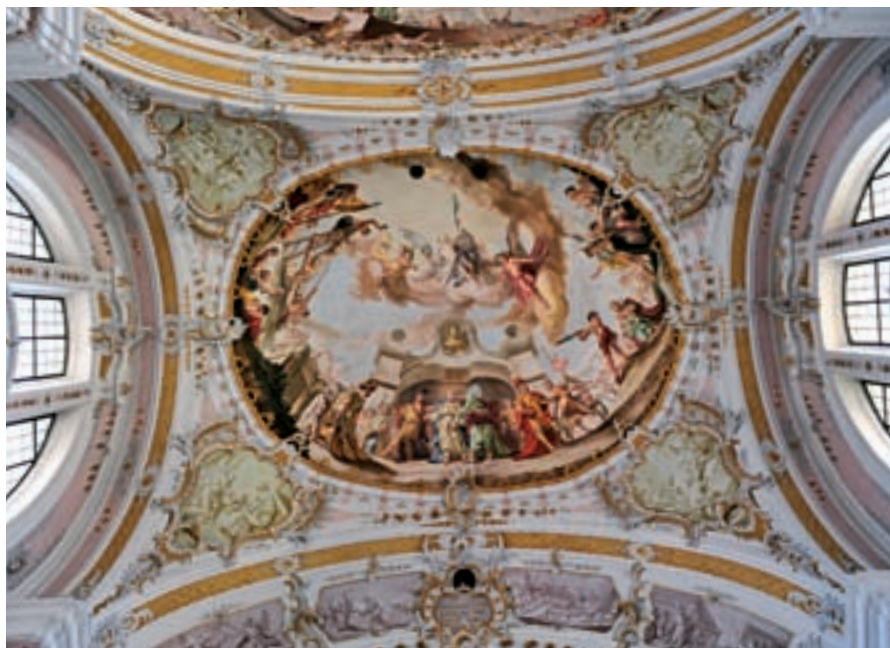
Götzens, Pfarrkirche hl. Petrus und Paulus, Deckenfresko im Langhaus