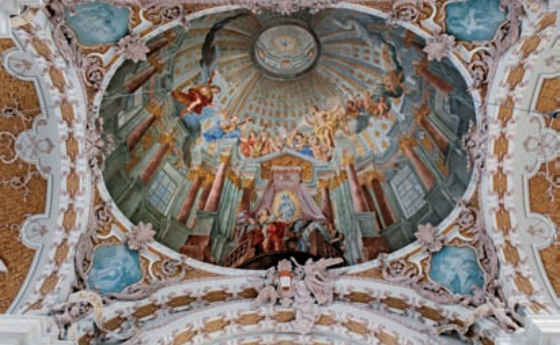
Innsbruck, Dom St. Jakob, Deckenfresko in der Vierung

hausjoch ist der Heilige als Fürbitter für die leidende Menschheit, im Emporenjoch als Fürbitter für Innsbruck, Tirol und die katholische Christenheit dargestellt) rekonstruiert und das Bogenfresko über dem Hochaltar (Erlösung der Menschheit durch das Lamm Gottes) 1950 von Hans Andre neu geschaffen.