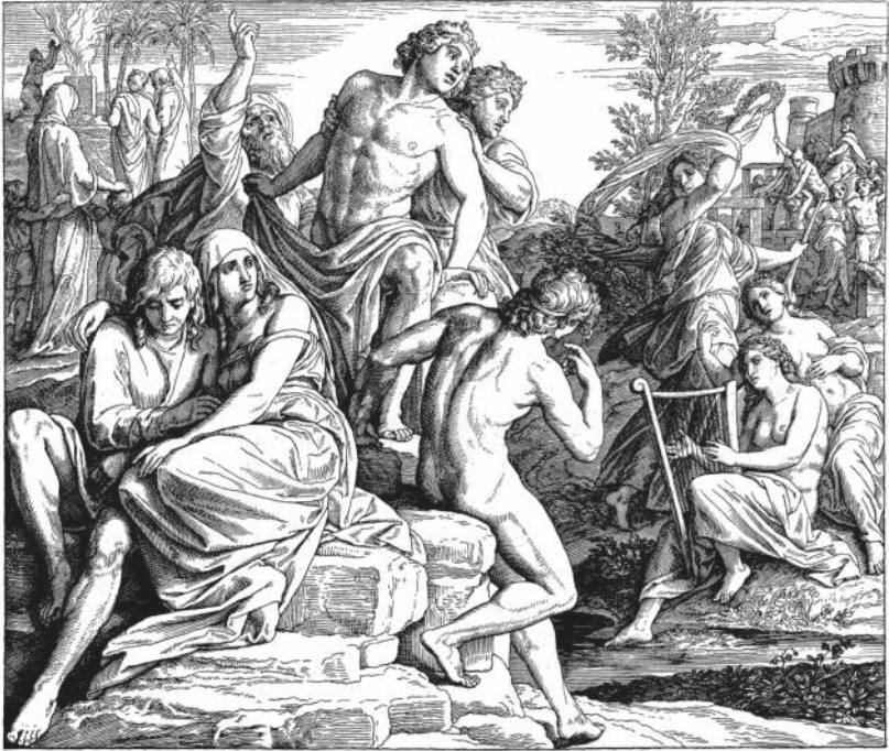
BOSHEIT DER MENSCHEN