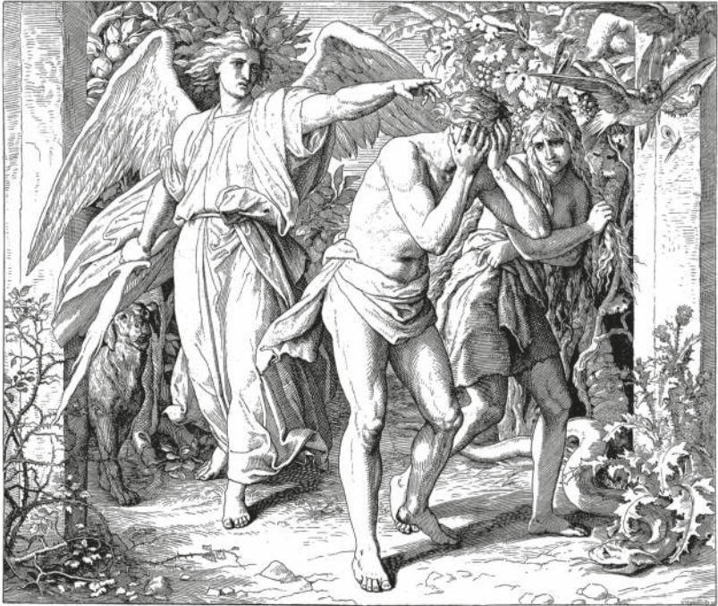
GOTT VERBANNT ADAM UND EVA