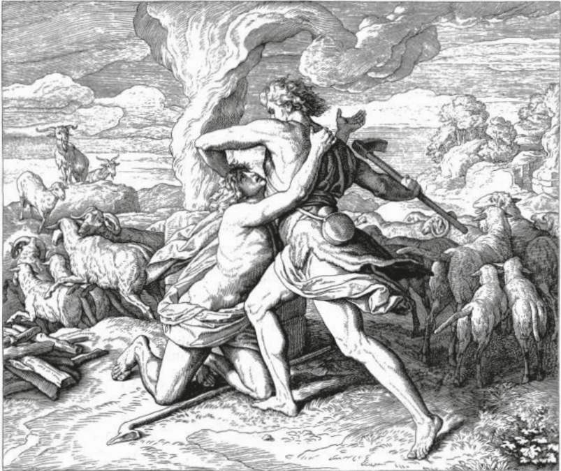
KAIN ERSCHLÄGT ABEL