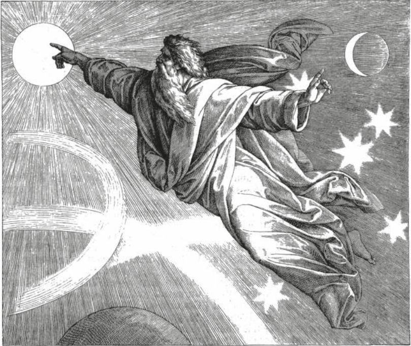
DER VIERTE TAG DER SCHÖPFUNG