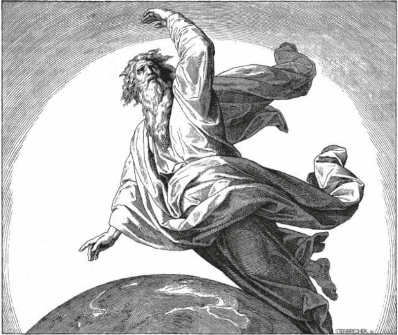
DER ZWEITE TAG DER SCHÖPFUNG