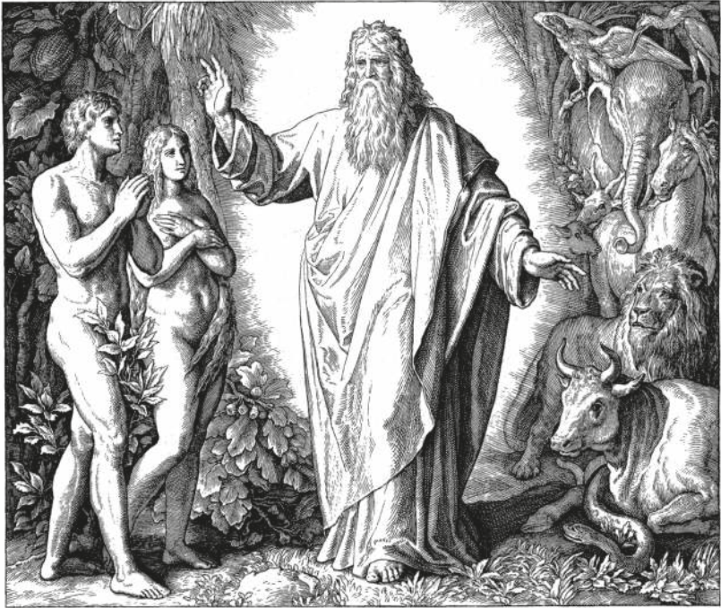
DER SECHSTE TAG DER SCHÖPFUNG