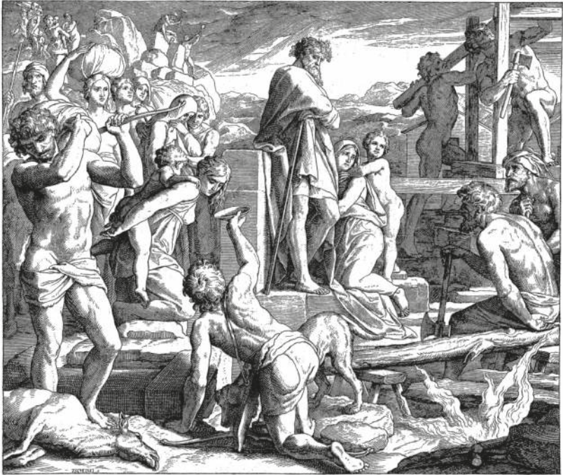
DIE VERBANNUNG KAINS