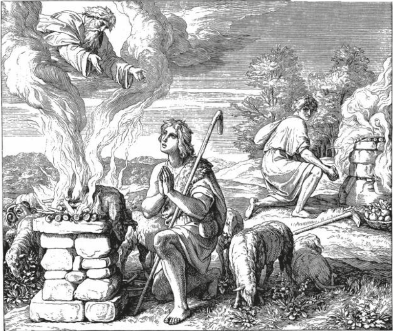
KAIN UND ABEL BRINGEN EIN OPFER DAR