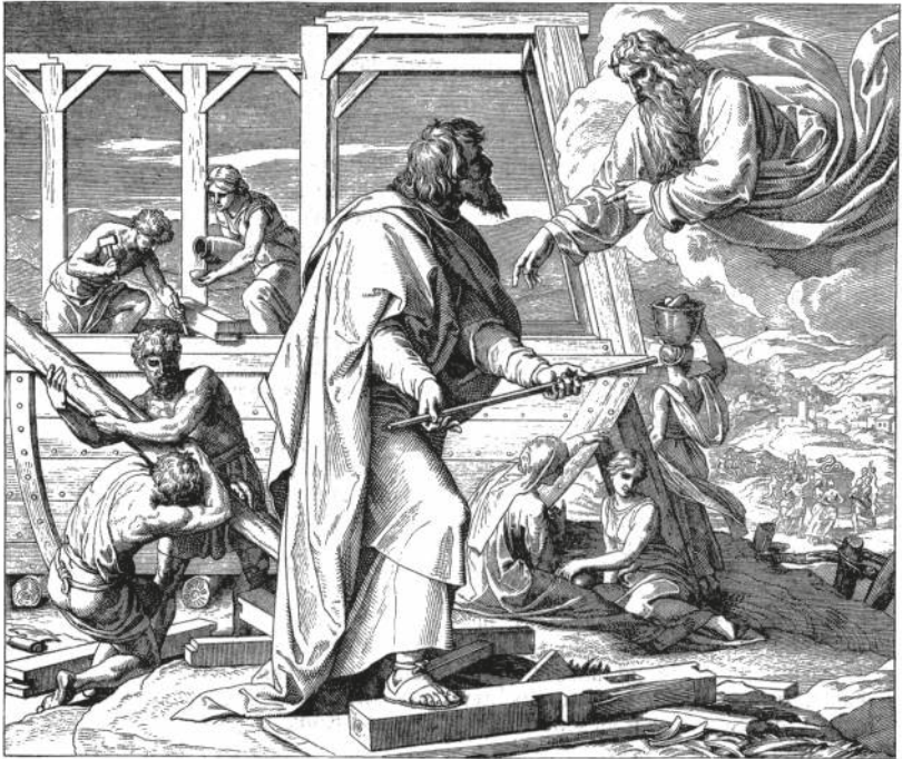
ANKÜNDIGUNG DER SINTFLUT