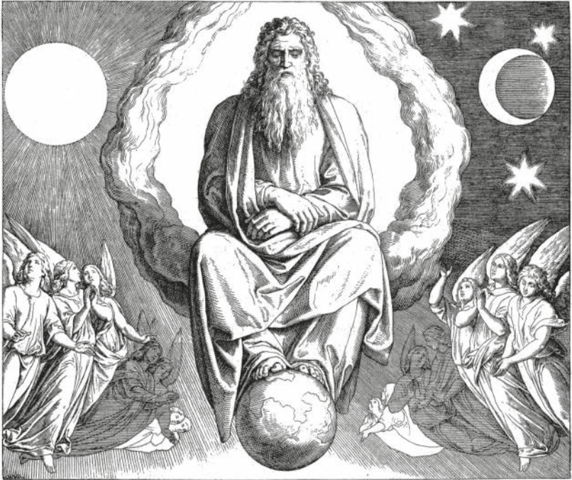
VOLLENDUNG DER SCHÖPFUNG