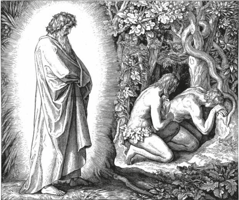
ADAM UND EVA SCHÄMEN SICH VOR GOTT