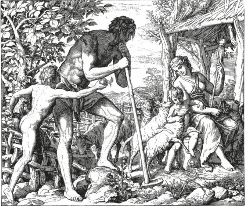
ADAM UND EVA UND IHRE SÖHNE