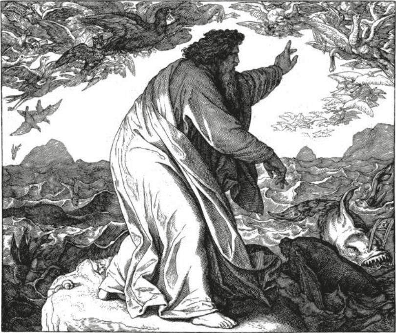
DER FÜNFTE TAG DER SCHÖPFUNG