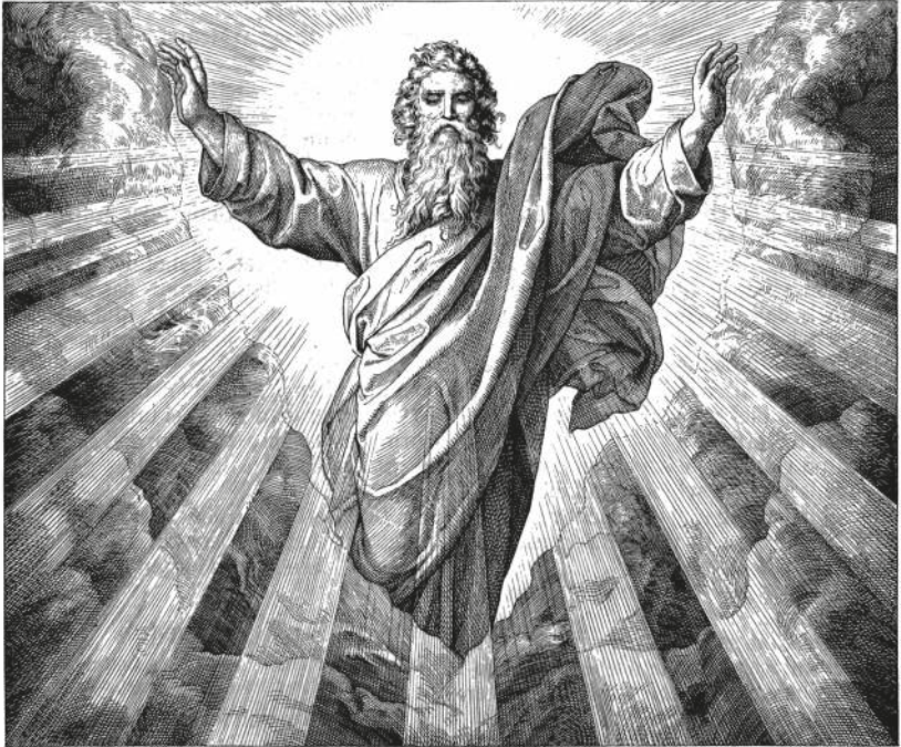
DER ERSTE TAG DER SCHÖPFUNG