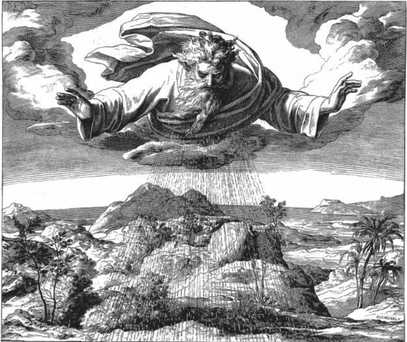
DER DRITTE TAG DER SCHÖPFUNG