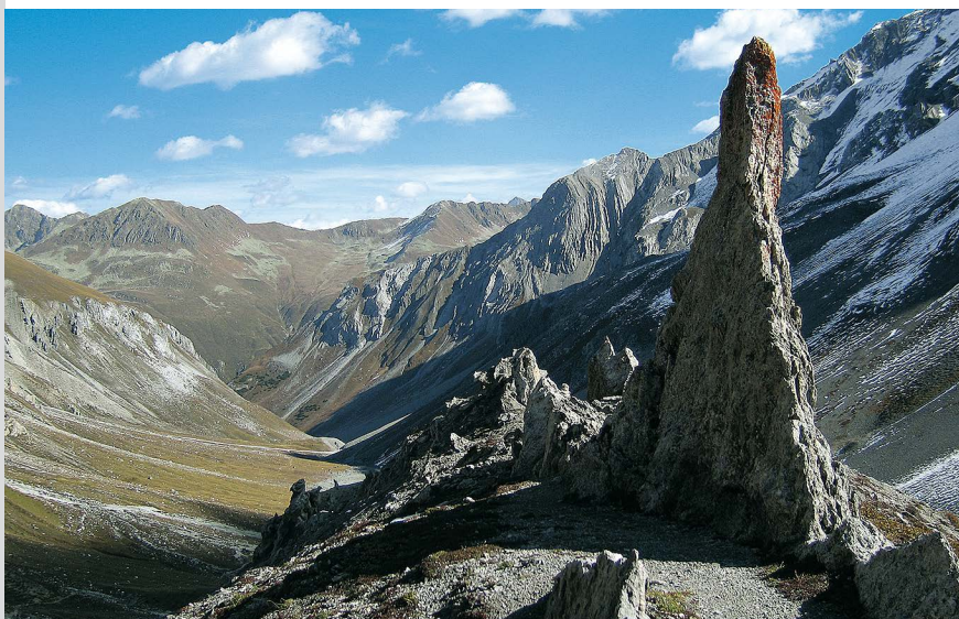
Auffälliger Felszahn im Ducantal auf dem Abstieg nach Sertig Dörfli.