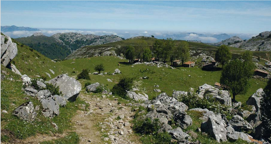
Au-dessus de la Vega de la Piedra la vue porte jusqu'à la côte.

Suivez de nouveau le lacet de pierres, qui vous mène légèrement à gauche à travers un alpage, jusqu'à un sentier battu qui monte. Peu après, de nombreuses sentes tracées par les humains et les animaux entaillent le tapis de verdure, grim pant le versant en petits lacets. Face à vous se dessinent les sommets du massif occidental, jusque tard dans l'année les blancs névés étincellent sur le calcaire gris. 30 min à peine après Canrasu vous vous trouvez au milieu de l'alpage à moitié abandonné de La Rondiella , 1352 m. Vous avez grimpé la moitié environ du dénivelé de cet itinéraire, la limite de la forêt est franchie, les alpages forment les uniques zones de végétation. Suivez le sentier à travers l'alpage. 20 min plus tard vous apercevez depuis le Collado Gamonal (5) , 1457 m, le Refugio tapi au pied des imposants versants. Le sentier vous conduit d'abord à gauche et passe devant le refuge, puis il décrit un virage à droite et arrive par l'arrière du Refugio de Vegarredonda (6) , 1470 m. Le sentier descend doucement un court instant, puis vous entamez la dernière montée jusqu'au Mirador. Un panneau annonce 2 h de marche, mais les randonneurs entraînés pourront boucler l'ascension