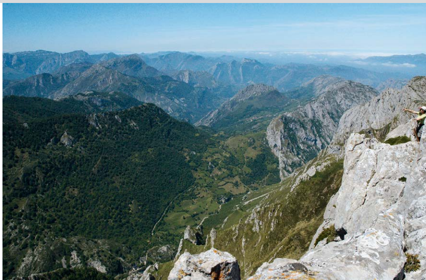
La vue depuis le Mirador de Ordiales récompense largement l'ascension.

Du parking de Buferrera (1) retournez par la route d'accès au Lago Enol , 1075 m, suivez la route à droite, puis prenez le sentier à gauche le long de la rive du lac (ou continuez simplement à suivre la route puis tournez à gauche direction Refugio Vega de Enol). Le sentier sur la berge rencontre une piste carrossable, et au bout de 30 bonnes min vous arrivez à la bifurcation vers le Refugio Vega de Enol . Passant devant les cabanes d'alpage de la Vega de Enol (2) la piste conduit en de doux reliefs, par le pâturage dans la cuvette de la Vega de la Cueva, jusqu'au Collado de Pandecarmen (3) ,