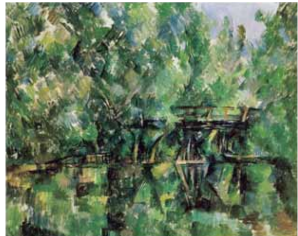
Der impressionistische Aufbruch in die Moderne: Paul Cezannes Brücke über den Teich , 1890

Wie sieht die »Kunst-Szene« aus, die Kandinsky erobern will? Noch herrscht hier ein anderer: Das künstlerische München ist fest in der Hand von Malerfürst Franz von Lenbach (Abb. links oben), dem Liebling von Kaiser und Reichskanzler. Aber der Siegeszug von Impressionisten und Jugendstil-Künstlern in den Salons ist nicht mehr aufzuhalten. Trotz starker konservativer Kräfte gilt die bayerische Residenzstadt neben Paris auf dem Gebiet der Kunst als Schmelztiegel der Moderne.