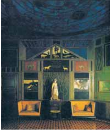
Oben: Musiksalon in der Villa des Münchner Jugendstil-»Papstes« Franz von Stuck Rechts: Sein berühmtes Gemälde Der Wächter des Paradieses , 1889