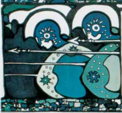
Noch ganz in Anlehnung an Jugendstil und Symbolismus gestaltet Kandinsky 1901 den Plakatentwurf zu seiner ersten »Phalanx«-Ausstellung