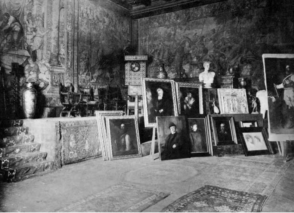
Kunstgeschmack am Ende des 19. Jahrhunderts: Althergebrachte Porträtmalerei in Lenbachs Atelier

So oft er kann, zieht er mit Malkasten und Studienblock ins Freie, ist mit seinem Tagwerk aber meist unglücklich und unzufrieden: »Nachher, besonders zu Hause, immer eine tiefe Enttäuschung. Meine Farben scheinen mir schwach, flach, die ganze Studie – eine erfolglose Anstrengung, die Kraft der Natur zu fangen.« Und ihm fehlt der Austausch, die Kommunikation und vor allem die Anerkennung: »Bedenkt man aber, dass man von niemandem ein einziges frisches Wort hört, wird einem das Herz schwer.«