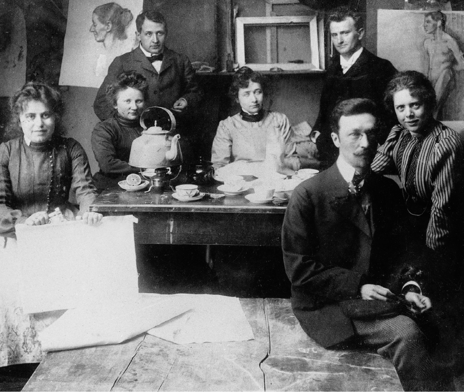
Wassily Kandinsky (vorne rechts) im Frühjahr 1902 mit Schülern seiner »Phalanx«-Malklasse, unter ihnen auch seine spätere Geliebte und Lebensgefährtin Gabriele Münter (Mitte)