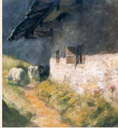
Kennzeichnend für den impressionistischen Stil: eine die Kontur auflösende Tupftechnik