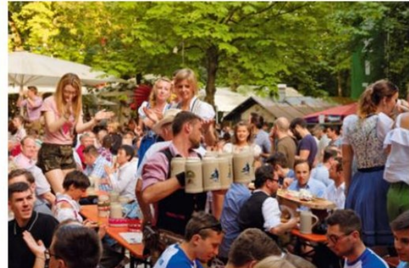
Unten: Der Berg ruft: Großer Andrang herrscht fast immer zur Erlanger Bergkirchweih, dem großen Bierkellerfest auf dem Burgberg, das alljährlich um Pfingsten herum stattfindet.