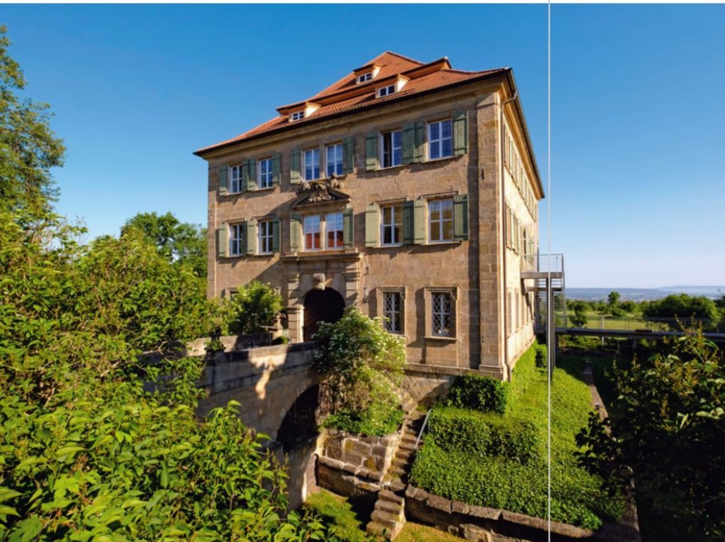
Links: Heute lässt man sich hier kulinarisch verwöhnen oder feiert gar seine romantische Hochzeit im Schloss Atzelsberg in der Gemeinde Marlöffstein.