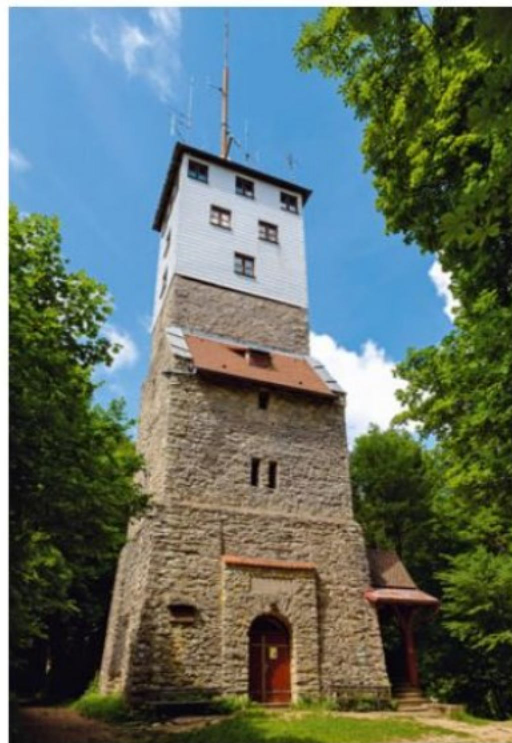
Links: Circa 30 Meter hoch ist der ab 1910 errichtete Moritzbergturm. Zuvor hieß der Aussichtsturm auch Bismarckturm und Hindenburgturm.