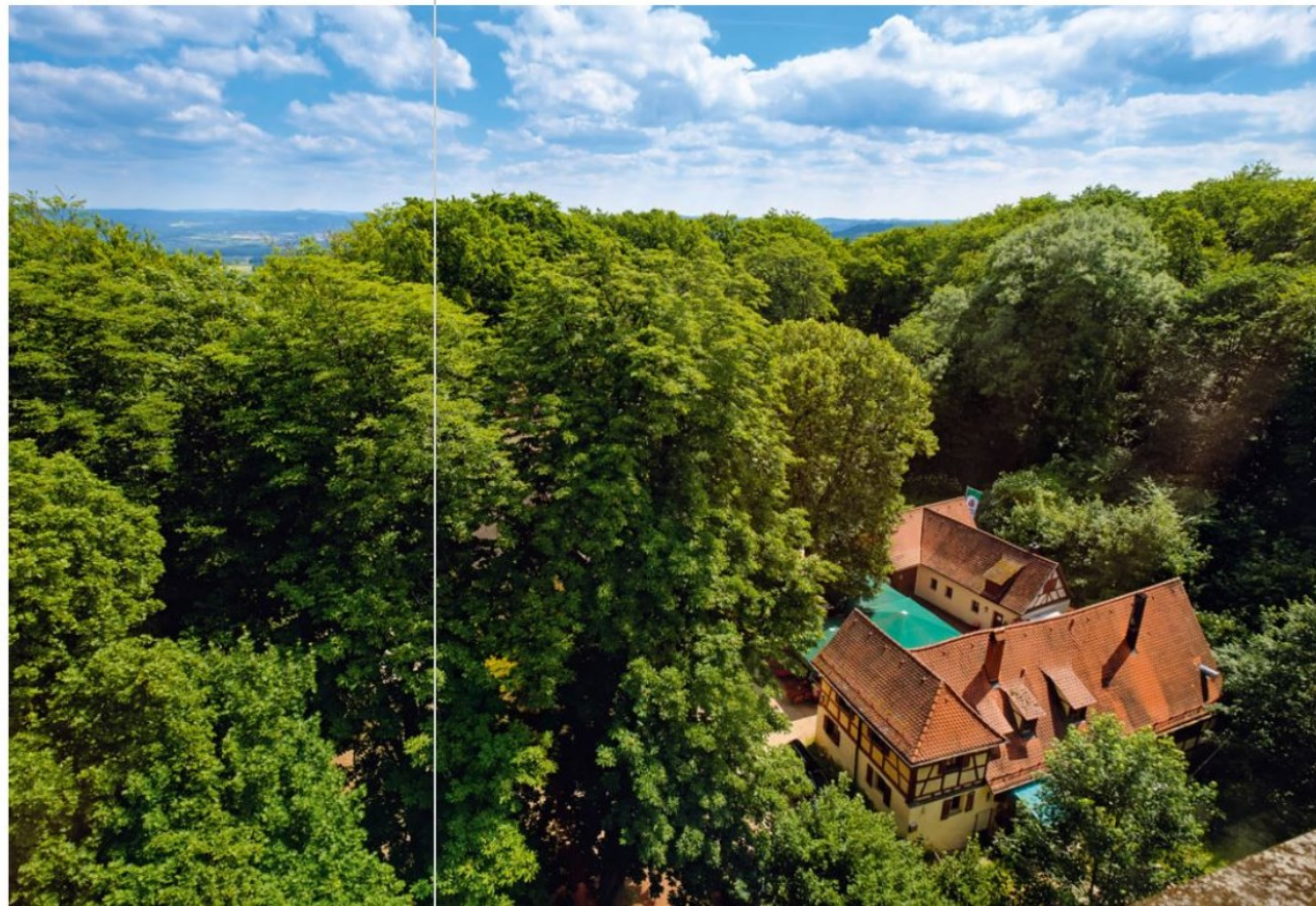
Unten: Weit reicht der Blick vom Moritzbergturm auf dem Gipfelplateau des Moritzberges. Der Zeugenberg der Fränkischen Alb ist etwa mehr als 603 Meter hoch und ein beliebtes Ausflugsziel der Nürnberger.