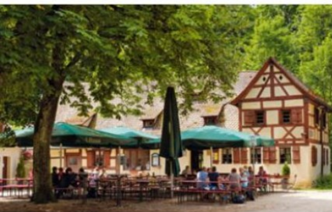
Links unten: Ein im 17./18. Jahrhundert errichtetes Bruderschaftshaus auf dem Moritzberg, diente zeitweise einem Einsiedler als Unterkunft und wird heute als Gastwirtschaft genutzt.