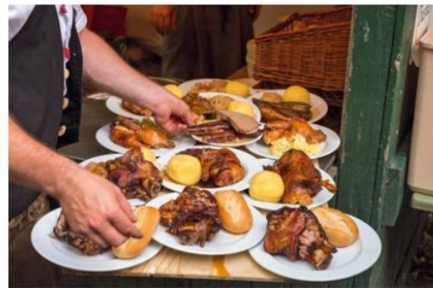
Oben: Wer viel Bier trinkt, braucht eine gute Grundlage. Auf der Erlanger Berg-