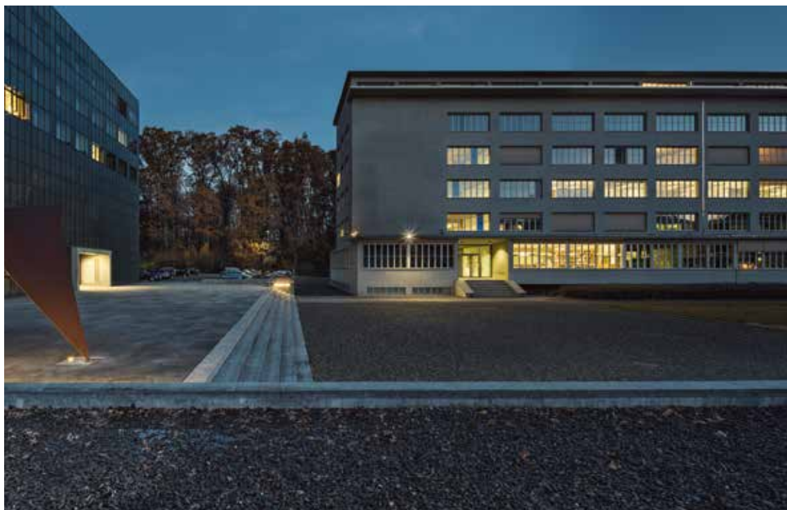
Südfassade des Hauptbaus, oben: 24.11.17, 10:42 Uhr links: 24.11.17, 7:30 Uhr