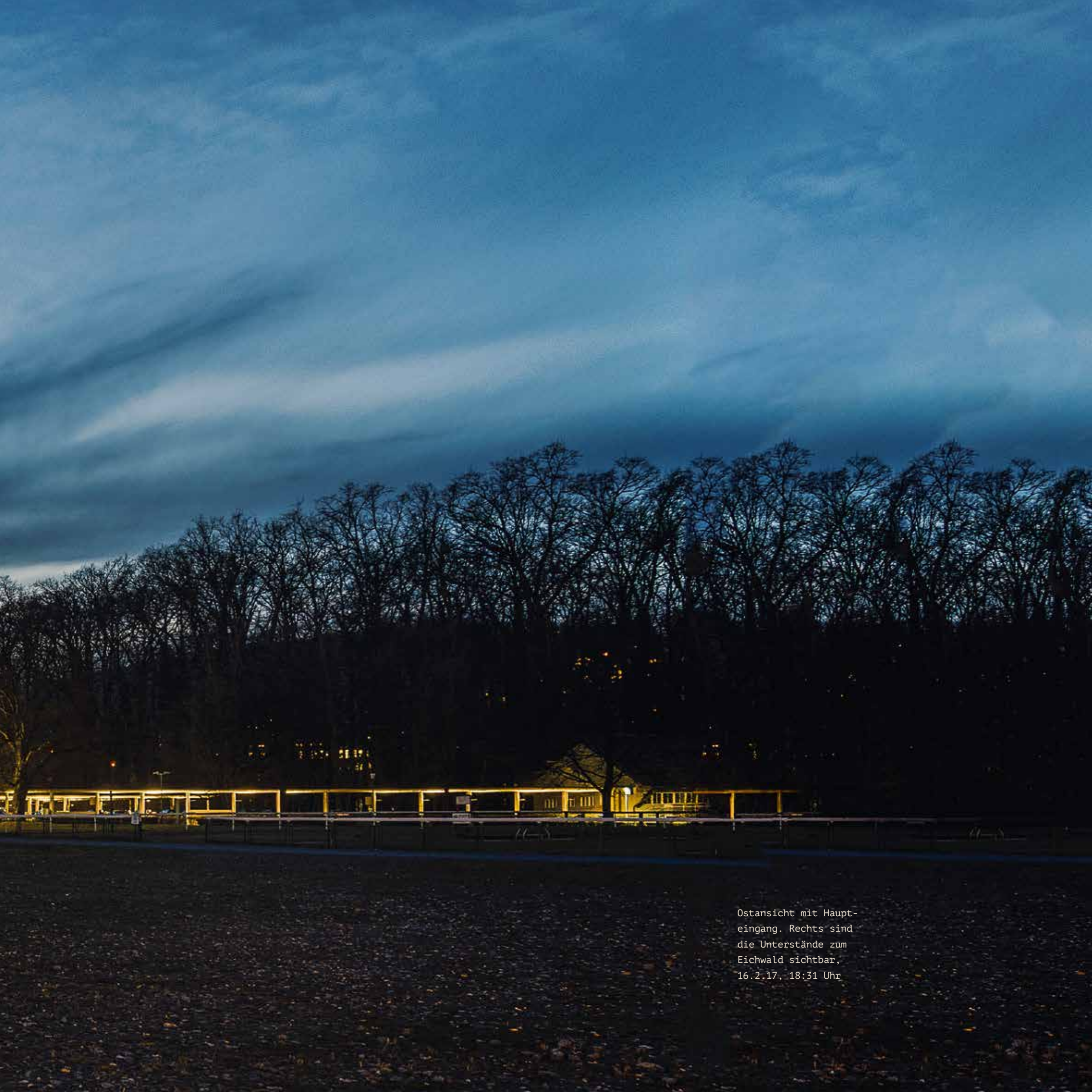
Ostansicht mit Haupt- eingang. Rechts sind die Unterstände zum Eichwald sichtbar, 16.2.17, 18:31 Uhr