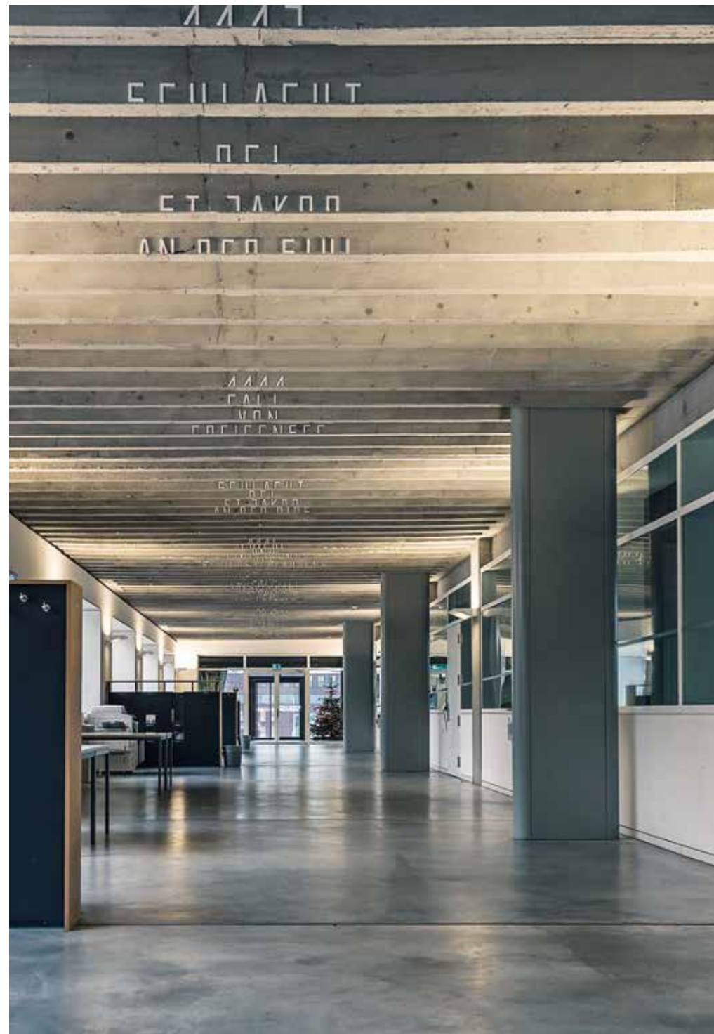
Verbindungskorridor mit der Rippendecke, die ursprünglich gestrichen war und nach der Restau- rierung roh belassen wurde, 16.12.15, 14:35 Uhr