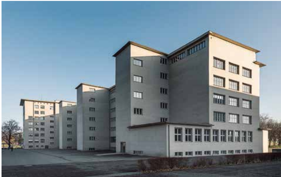
linke Seite: Südfassade, 13.12.15, 15:26 Uhr