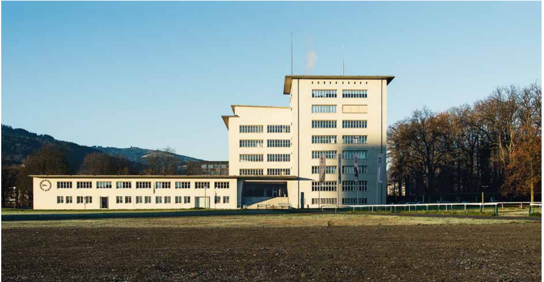
Ansicht von der Horwer- strasse auf die markante Silhouette. Das benach- barte Hochhaus-Allmend zeigt sich im langen Schattenwurf, 2.12.15, 8:52 Uhr