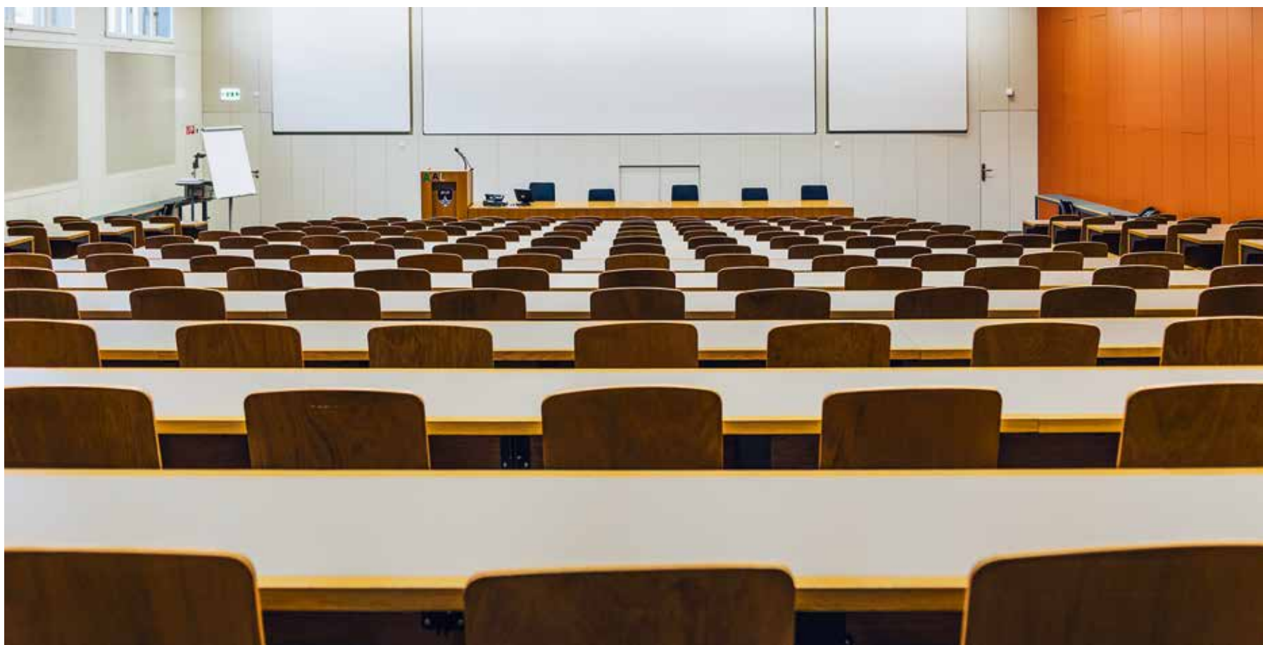
Grosses Auditorium, 16.12.15, 13:38 Uhr