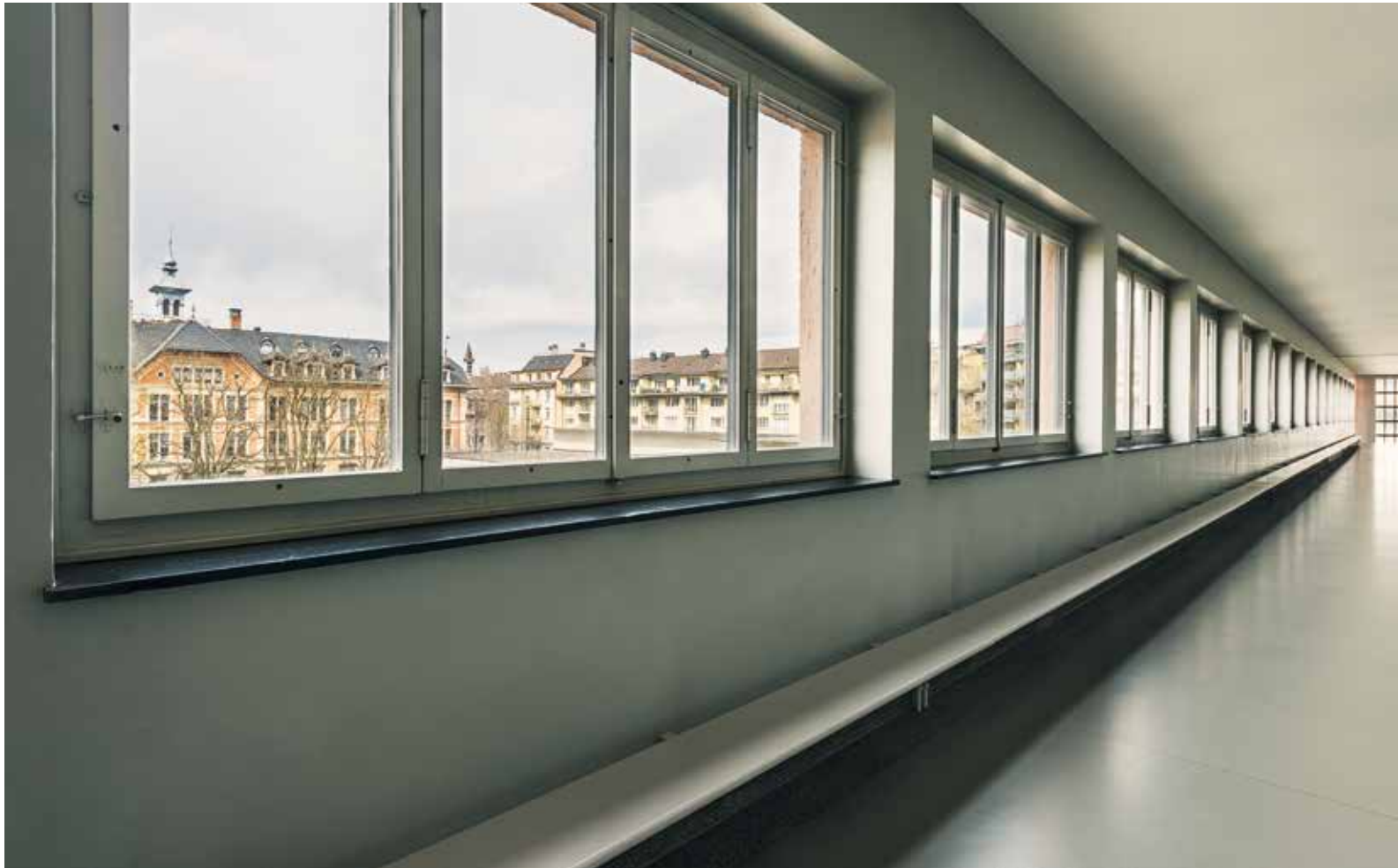
Dula-Schulanlage. Verbindungstrakt, 31.3.16, 13:12 Uhr