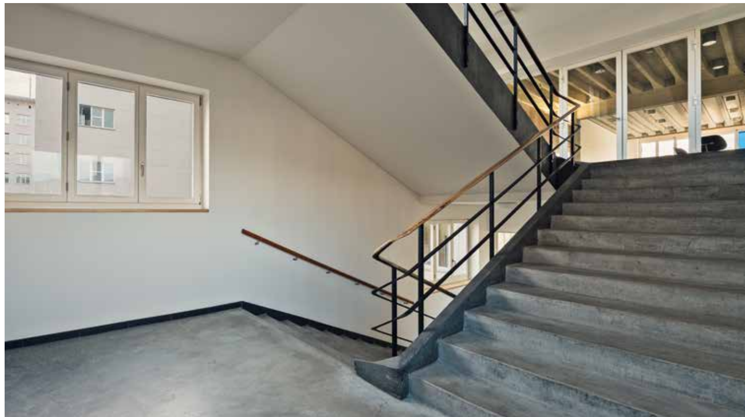
Eines der drei Treppenhäuser im Hauptbau zu den oberen Unterrichtszimmern und Schlafzimmern, links: 16.12.15, 15:08 Uhr, oben: 21.11.17, 9:12 Uhr