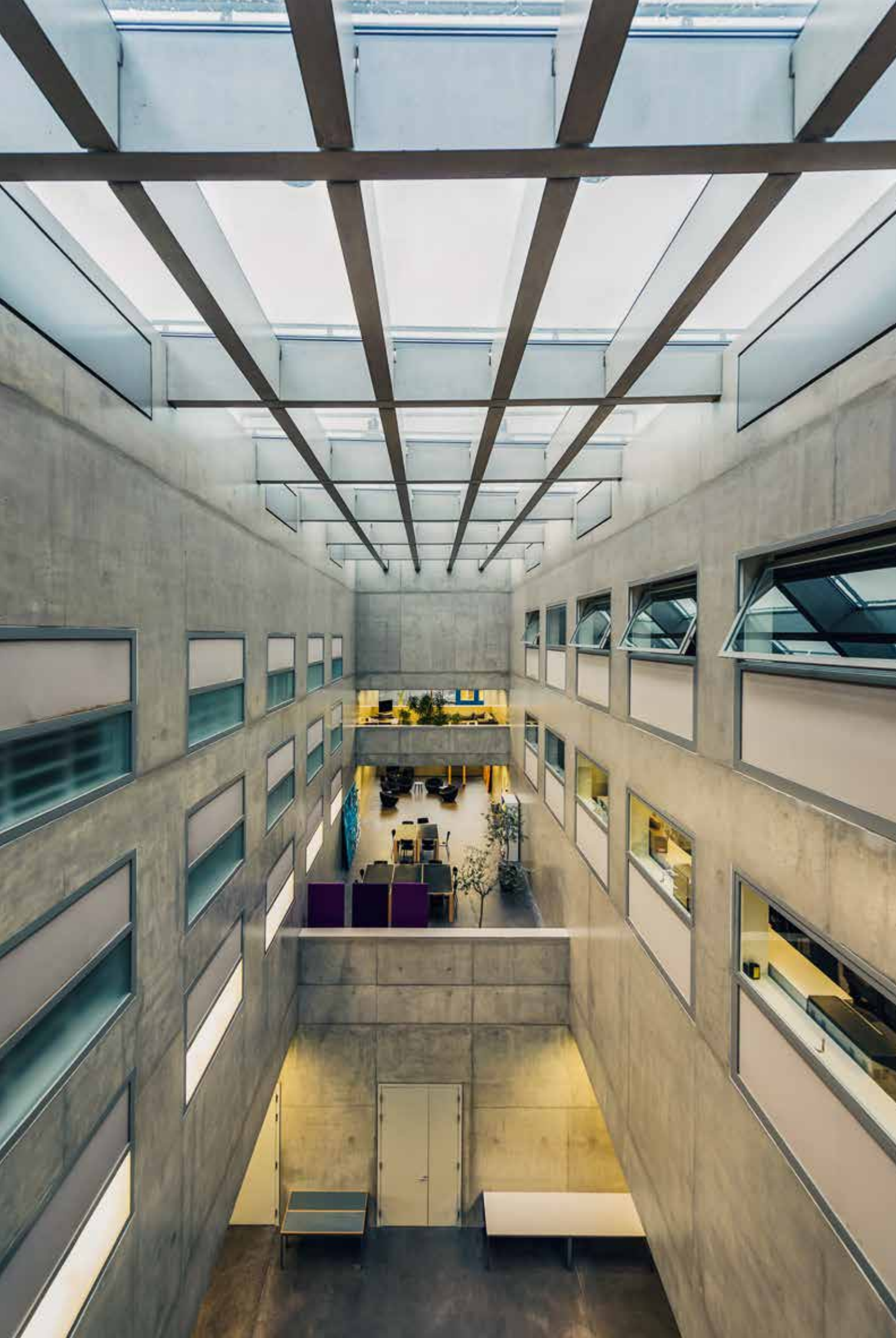
Der Innenraum erstreckt sich über vier Stockwerke, 16.12.15, 15:27 Uhr