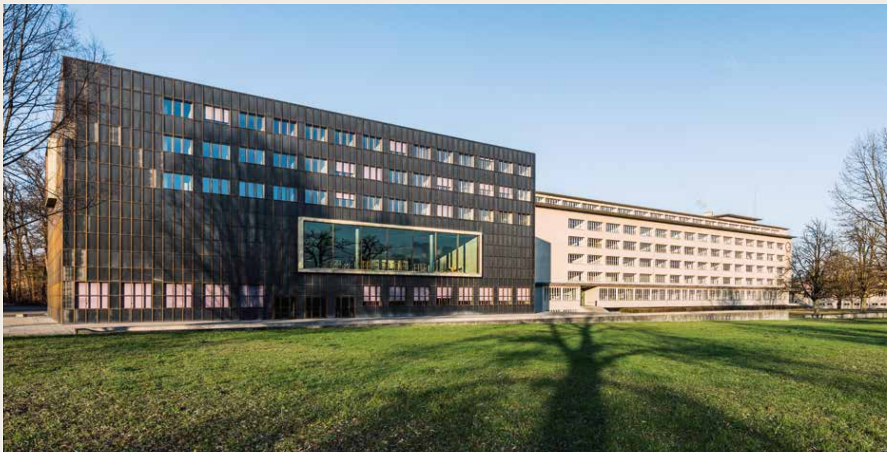
Die beiden Bauten verkörpern zwei Generationen und wirken trotzdem als Einheit, 6.12.15, 15:17 Uhr