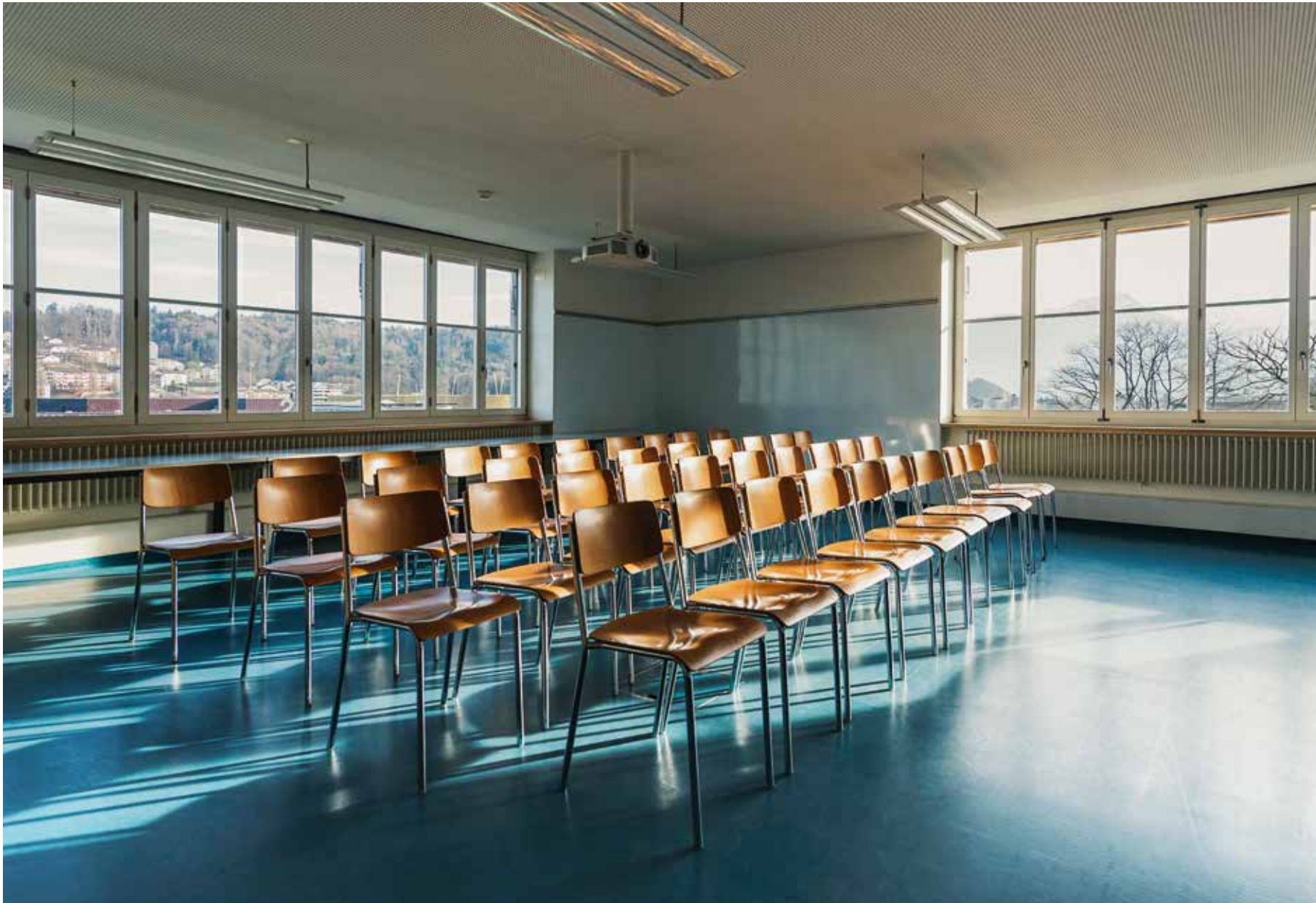
Lichtdurchflutetes Unterrichtszimmer mit sparsamem Innenausbau, oben: 22.12.15, 14:10 Uhr, unten links: 22.12.15, 14:07 Uhr, unten rechts: 22.12.15, 15:19 Uhr