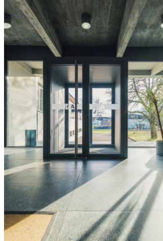
Grosszügiger Eingangsbereich, links: 22.12.15, 14:27 Uhr, rechts: 22.12.15, 14:22 Uhr